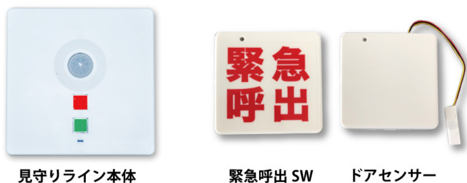
見守りライン本体