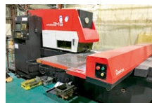
タレットパンチプレス加工機